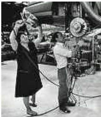
Mirafiori Operai negli anni Settanta