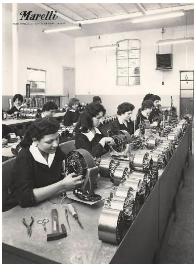
Pagina precedente e sopra Scuola professionale della Ercole Marelli per apprendiste avvolgitrici, Sesto San Giovanni, 1960

Nella sezione PCTO troverete due tipologie di progetti. Progetti già strutturati, in via di realizzazione o in partenza in quest'anno scolastico. Questi PCTO sono rivolti alle classi nella loro interezza. Per avere informazioni sulla possibilità di replicare queste esperienze il nostro indirizzo e-mail è a disposizione nella sezione Contatti. Percorsi individualizzati rivolti a singoli studenti. Questi PCTO si svolgono interamente nella nostra sede tra maggio e giugno e prevedono approfondimenti, lavoro su documenti d'archivio e uscite sul territorio. I nostri PCTO non prevedono la modalità on-line.