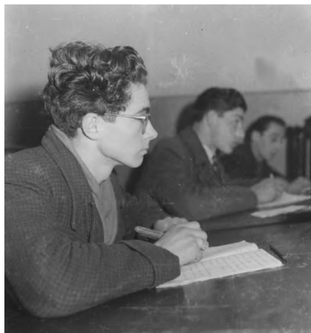
Allievo della scuola di avviamento professionale della Breda, Sesto San Giovanni, 1944-45

Si segnala che a questo Piano dell'offerta formativa seguirà per ciascun corso l'invio di una comunicazione più dettagliata, contenente il programma e le indicazioni specifiche per i docenti interessati.