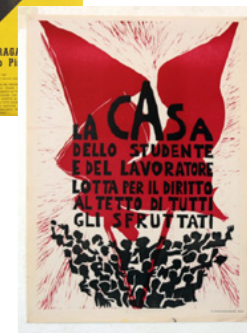
Le immagini che illustrano l'Annual Report appartengono alle collezioni della fondazione, tranne quelle dell'allestimento della mostra "Un grande numero" per le quali ringraziamo Paola Fortuna e i fotografi dello IUAV Umberto Ferro e Luca Pilot.